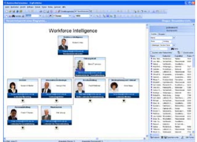
Mit OrgPublisher können Sie schnell verlässliche und informative Berichte zur Arbeitskräfteverwaltung sowie Organigramme erzeugen.