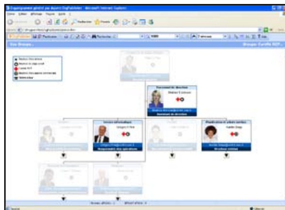
La mise en évidence vous permet d'identifier très rapidement les personnes correspondant à vos critères de recherche.